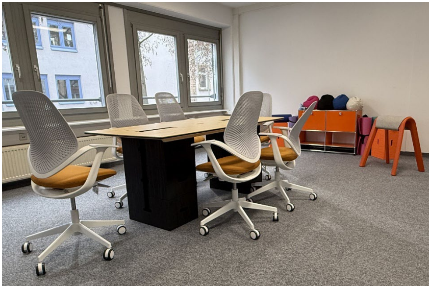
Bild 4: Moderne und lernfreundliche Räumlichkeiten im SRH Beruflichen Trainingszentrum Karlsruhe.