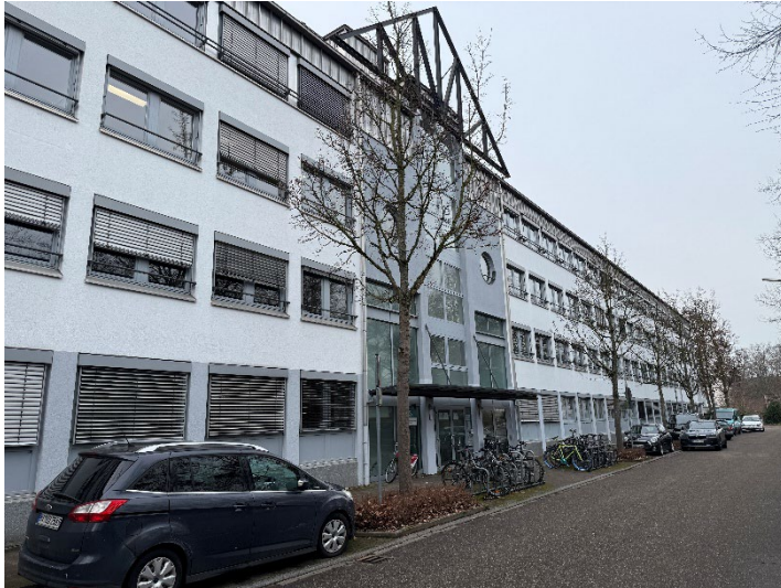
Bild 3: Außenansicht des SRH Beruflichen Trainingszentrums Karlsruhe