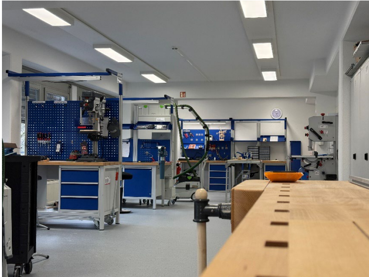
Bild 5: Multifunktionsraum im SRH Beruflichen Trainingszentrum Karlsruhe